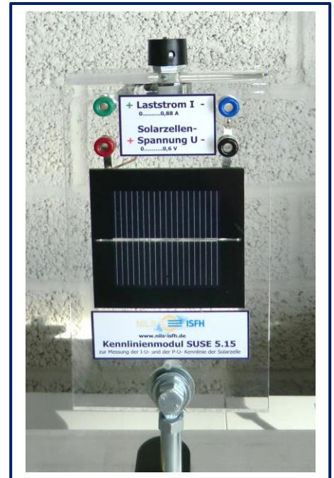
Foto rechts: In der Mitte des Gerätes befindet sich die Solarzelle SUSEmod2 (0,61 V/900 mA), darüber das schwarz- rote Buchsenpaar zur Messung der Solarzellenspannung, das grün- blaue Buchsenpaar zur Messung des Laststroms, ganz oben das Last- Potenziometer mit dem schwarzen Drehknopf.

Die Messungen lassen sich mit Multimetern, mit einem Oszilloskop oder unter Verwendung eines computergesteuerten Messwertsystems (Cassy o.ä.) mit hoher Genauigkeit schnell PC- gesteuert durchführen.