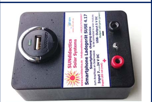
Der DC-DC- Wandler SUSE 4.17